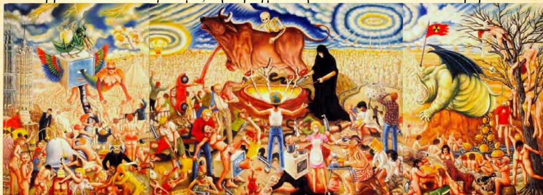
Kali Yuga. Από τον Dorian X

Οι επιστήμες καταδικάζουν κάθε αναφορά σε ιερότητα θεωρώντας την ως ηλίθια δεισιδαιμονία, κόρη της ωμής άγνοιας. Τα πάντα έδωσαν τη θέση τους στις τεχνολογικές προόδους της επιστήμης, χρήσιμες για την καθημερινή ευημερία και υγεία της ανθρωπότητας, αλλά ταυτόχρονα μεγέθυναν τις ορέξεις που απορρέουν από τον εγωισμό, την πραγματική ασθένεια αυτού του θλιβερού αιώνα.