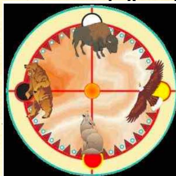
Ruota di Medicina