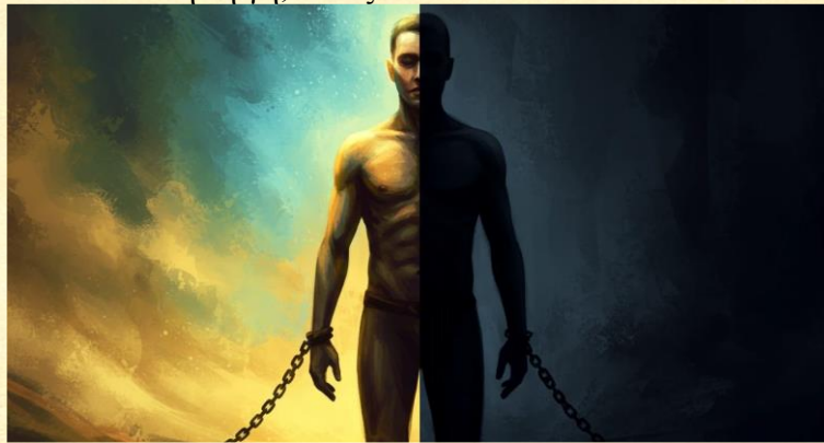
Φως και Σκιά. Ανωνύμου

Τι είναι οι άνθρωποι πάνω σε αυτή τη γη; Σκιές!