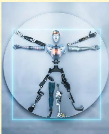
Ο Βιτρούβιος άνθρωπος

Μένει μόνον η ανθρωπότητα να τα λάβει υπόψη της. Διότι στον δρόμο προς την υλική πρόοδο έχασε το δρόμο της.