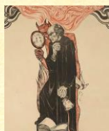
Φάουστ και Μεφιστοφελής

Ας το προσέξουμε και ας διαλογισθούμε πάνω σε αυτό.