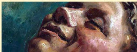
Ενθουσιασμός – Kristian Zahrtmann

Ενθουσιασμός, μία λέξη Ελληνική από το εν (εντός) και Θεός. Ο Θεός εντός μας. Κατά διάφορες εκδοχές αναλογεί στην ερμηνεία της Εβραϊκής λέξης Emmanuel που σημαίνει «Ο Θεός εντός μας».