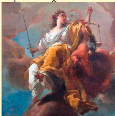
Αλληγορία της Δικαιοσύνης. Gaetano Gandolfi

Ποτέ μία λέξη δεν καταχράσθηκε τόσο πολύ όσο η «Ελευθερία». Χρησιμοποιήθηκε διακαώς από εκείνους οι οποίοι αγνοώντας τις πολλές θυσίες και φτιαγμένοι για να απελευθερωθούν από τους τυράννους της στιγμής, ποτέ δεν αγωνίστηκαν για να την επιβεβαιώσουν στην ολότητά της. Η ελευθερία ξεκινά με τον σεβασμό του ηττημένου αντιπάλου, για να συνοδευθεί αμέσως μετά από έλεος και οίκτο. Οι νέοι «ψευδο-ιπότες» του καλού, ασκούν στην πραγματικότητα μια ψευδοελευθερία που στην πραγματικότητα είναι μια νέα μορφή τυραννίας. Η ελευθερία είναι μια κατάσταση συνείδησης, μια ανύψωση πνευματική, μία απόσπαση από το σχέδιο των υλικών αναγκών.