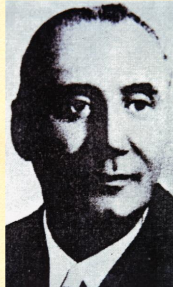
Ottavio Ulderico Zasio

Ο Ottavio Ulderico Zasio υπήρξε ένας από τους πλέον αυθεντικούς Ροδόσταυρους του Αληθούς και Χρυσού Ρόδου και Σταυρού του Λατινικού κλάδου 3 . Ο Francesco Carraro Zasio μικρανησιός του Ο.Υ.Ζasio είναι ακόμη σε επαφή μαζί μας και μας έχει παραδώσει αρκετά από το αρχείο του σημαντικού του θείου. Μία Στοά του Τύπου μας στο Frosinone 4 φέρει το όνομά του.