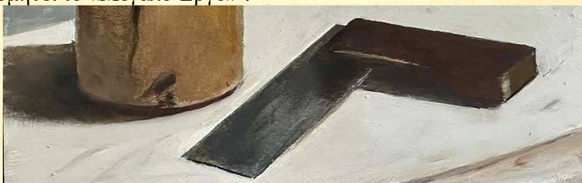
Νεκρή φύση με γνώμονα και σφύρα – Jon Peters

Είναι εξίσου αληθές ότι κάθε λίθος πρέπει να είναι τετραγωνισμένος για να τοποθετηθεί δίπλα σε άλλους και να οικοδομηθεί το «Μεγάλο Έργο» 1 .