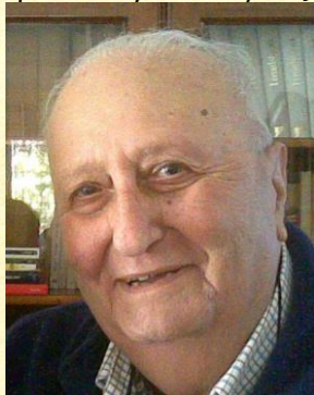
Sebastiano Caracciolo (Vergilius)

Παίρνοντας θάρρος τον ρώτησα: «Διδάσκαλε γιατί με έφερες μέχρι εδώ; Θα μπορέσουμε να συνεχίσουμε αυτό το ταξίδι έως την κορυφή του Μεγάλου Όρους;»