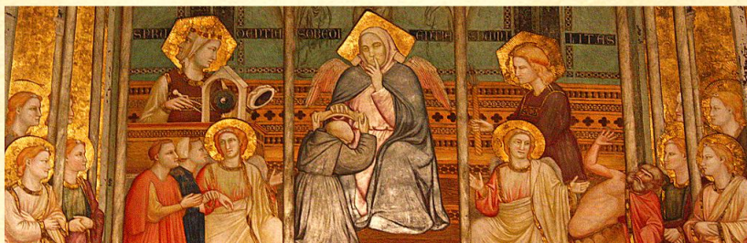
Αλληγορία στην Πειθαρχία.

Η υπακοή, σωστά ερμηνευμένη, περιλαμβάνει την υποταγή αφενός στην εμπειρία και τη σοφία αυτών οι οποίοι μέσα στην κοινότητά μας έχουν το βάρος και την ευθύνη που απορρέει από τους υψηλότερους βαθμούς, εν γνώσει του μονοπατιού Μύησης που έχει αναληφθεί, ενώ από την άλλη προσφέρει την ευκαιρία να απελευθερωθούμε σταδιακά από την υπερηφάνεια και την ματαιοδοξία.