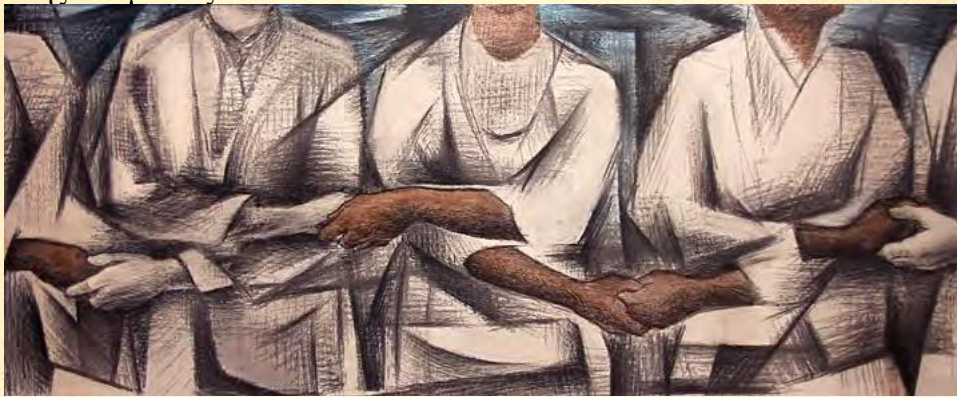
Άλυσοι. Edward Biberman

Το μεγάλο χάος 2 , αφού επηρέασε το μυαλό και τις καρδιές της ανθρωπότητας προκειμένου να επιτύχει τους σκοπούς του, ετοιμάζεται για τον τελευταίο του χτύπημα. Να καταστρέψει κάθε ίχνος αυθεντικής και ειλικρινούς Παραδοσιακής Νοοτροπίας σε όσους λίγους Μυητικούς χώρους επιβίωσαν της καταστρεπτικής του μανίας.