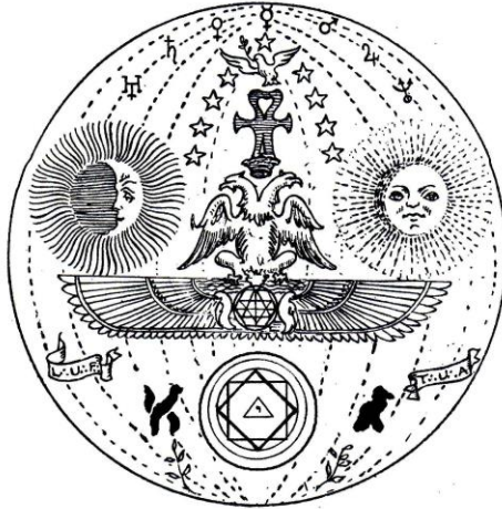
Σύμβολο του Αρχαίου και Αρχέγονου Ανατολικού Τύπου Misraim και Memphis

Θα πρέπει να περάσει ακόμα πολύ καιρός προτού συνετελεσθεί η συγχώνευση μεταξύ μύησης και χειροτονίας, που θα επισημοποιήσει το τέλος του αγώνα και την απαρχή της ανόδου της ανάληψης θείας συνείδησης από την πλευρά της ανθρωπότητας!