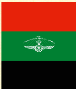
το Λάβαρο του Τύπου μας

Ο δεύτερος και τρίτος βαθμός αντιπροσωπεύουν νέα επίπεδα μάχης και απελευθέρωσης.