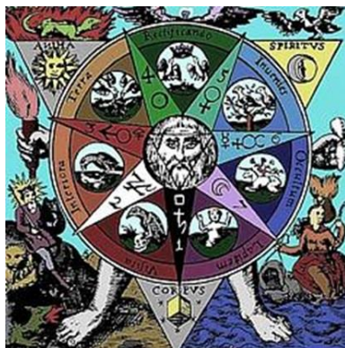
Το Azoth των Φιλοσόφων

• Τώρα πλησιάστε τον, σφίξτε του το χέρι και δώστε του το φορτισμένο με δονήσεις ωραιότητας αντικείμενο. Νοιώστε τες να διαλύουν τη δυσαρμονία που υπήρχε στις σχέσεις σας. Νοιώστε την αρμονία, την ωραιότητα και την αγάπη να πλημμυρίζει το είναι σας.